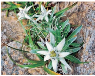
ハヤチネウスユキソウ

もう一つの趣味は温泉、いつもハイキングのすぐあとに行くんです！登山のあとだけでなくどんな日でも疲れた筋肉を癒すにはこれがベストです。私のお気に入りには花巻南温泉郷の大沢温泉です。多くの種類の温泉が楽しめます。みなさんご存じの混浴も。（男性も女性も一緒に湯船に