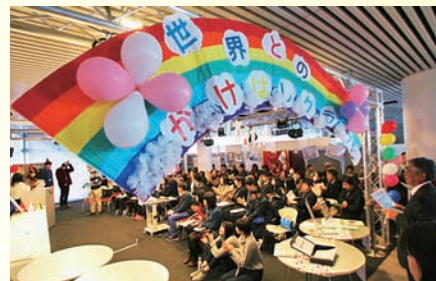
世界とのかけはしクラブ