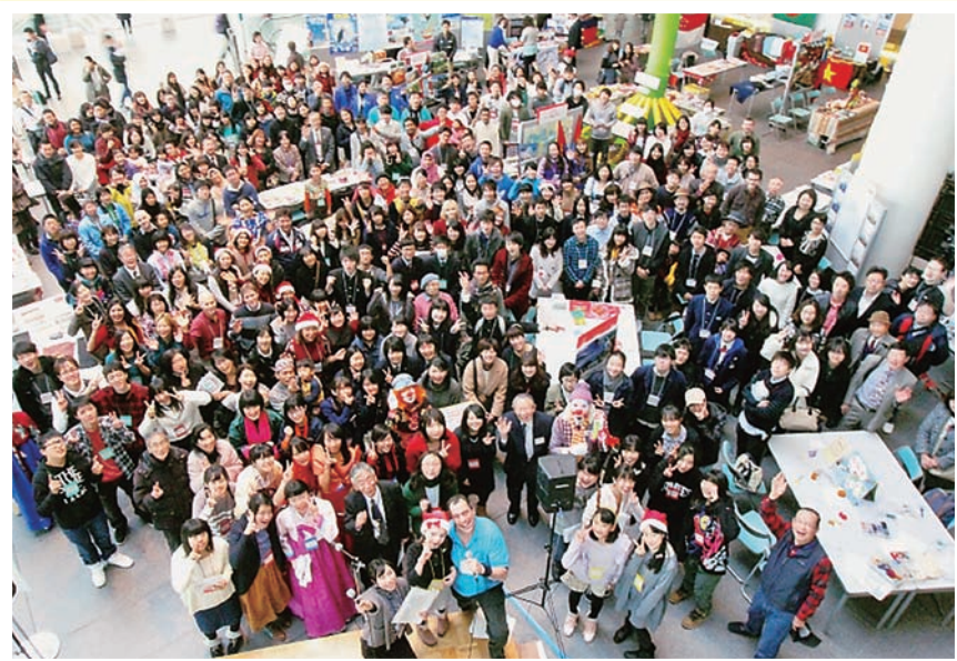
写真は昨年の様子